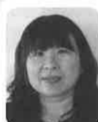
畢 磊 ビレイ